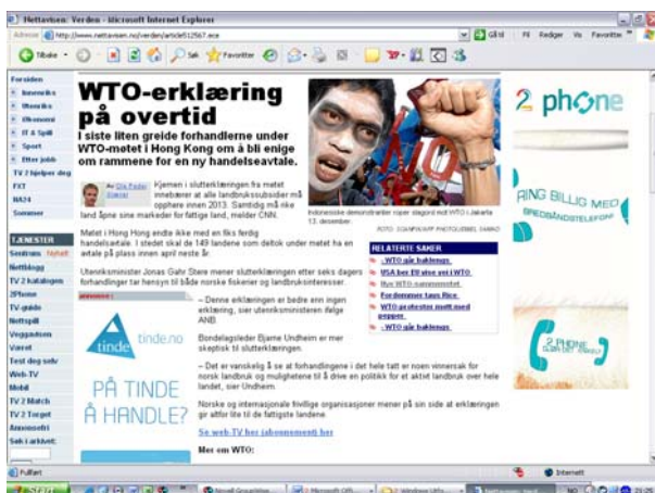
Illustrasjon 2: Linken " Se web-tv her ( abonnement ) her " (sic) uthevet nederst i skjermbildet til venstre i artikkelen "WTO-erklæring på overtid" (TV2 Nettavisen 19.12.05).

Det skaper også forvirring ved at det er linker i listene til både originalartikkel og den oppdaterte versjonen, hvor linkene har forskjellige navn. Og det er linker til den samme tilknyttede artikkelen i både teksten og i listen, og da med to ulike linknavn. I for eksempel "Demonstranter kastet seg i vannet" (VG 13.12.05) finnes linken Jose Bove ble stanset i teksten og Kjendisaktivist fengslet før WTO-møtet i linkelisten, hvor begge er link til artikkelen "Kjendisaktivist fengslet før WTO-møtet" (12.12.05).